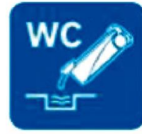
VACIADO AGUAS NEGRAS