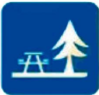
ZONA DE PICNIC