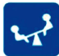
ZONA DE JUEGOS