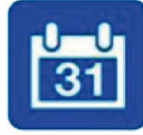
ABIERTA TODO EL AÑO