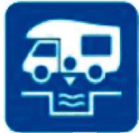
VACIADO AGUAS GRISES